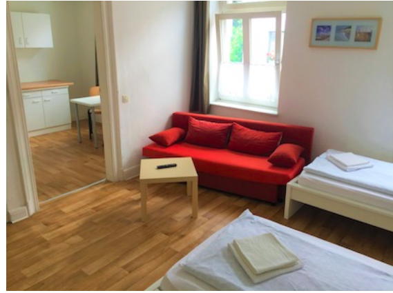
Küche / Essen