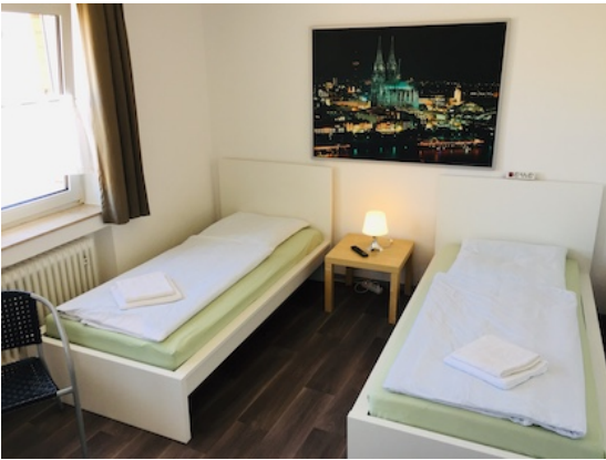
Schlafzimmer mit zwei Einzelbetten