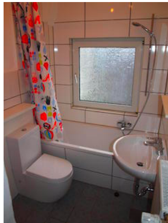
Badezimmer mit Duschwanne und WC