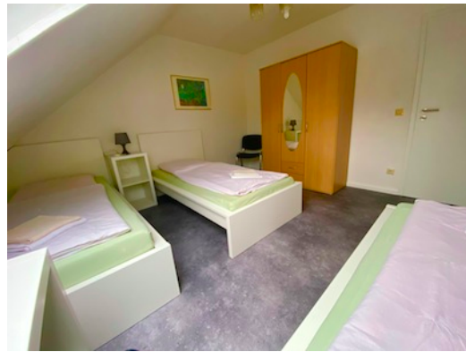
Einzelarest. Notzimmer, da keine Stehhöhe!