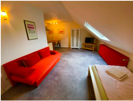
Schlafzimmer mit 3 Einzelbetten